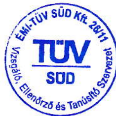
GÁL ILONA ÉMI-TÜV SÜD Kft.