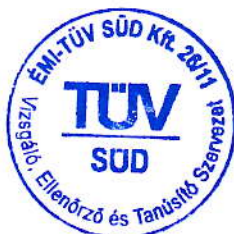
GÁL ILONA ÉMI-TÜV SÜD Kft.