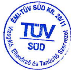
GÁL ILONA ÉMI-TÜV SÜD Kft.